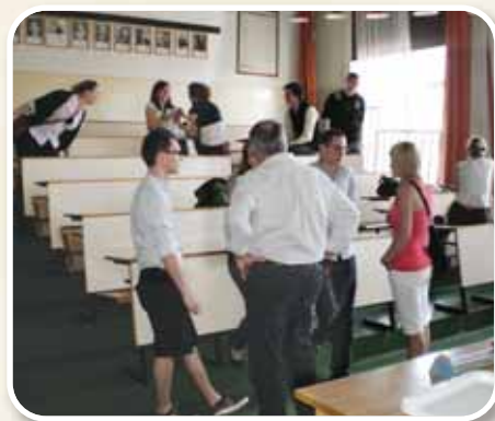
A képen épp a fizika előadót szemlélik meg volt diákjaink.

(volt fasori diák, a gimnázium angol-francia szakos tanára, a találkozó szervezője)